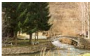
Planiranje ruralnog razvojnog procesa (Po lider konceptu)

otkrivanje problema i mogućnosti, kreiranje moguće intervencije, osmišljavanje grupe programa ili projekata, donošenje odluka, implementacija, monitoring i evaluacija.