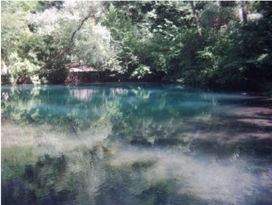
Fotografija: Vrelo Mlave